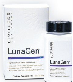
LunaGen™ 60 capsules