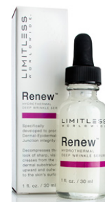
Renew 1 fl. oz. / 30 ml